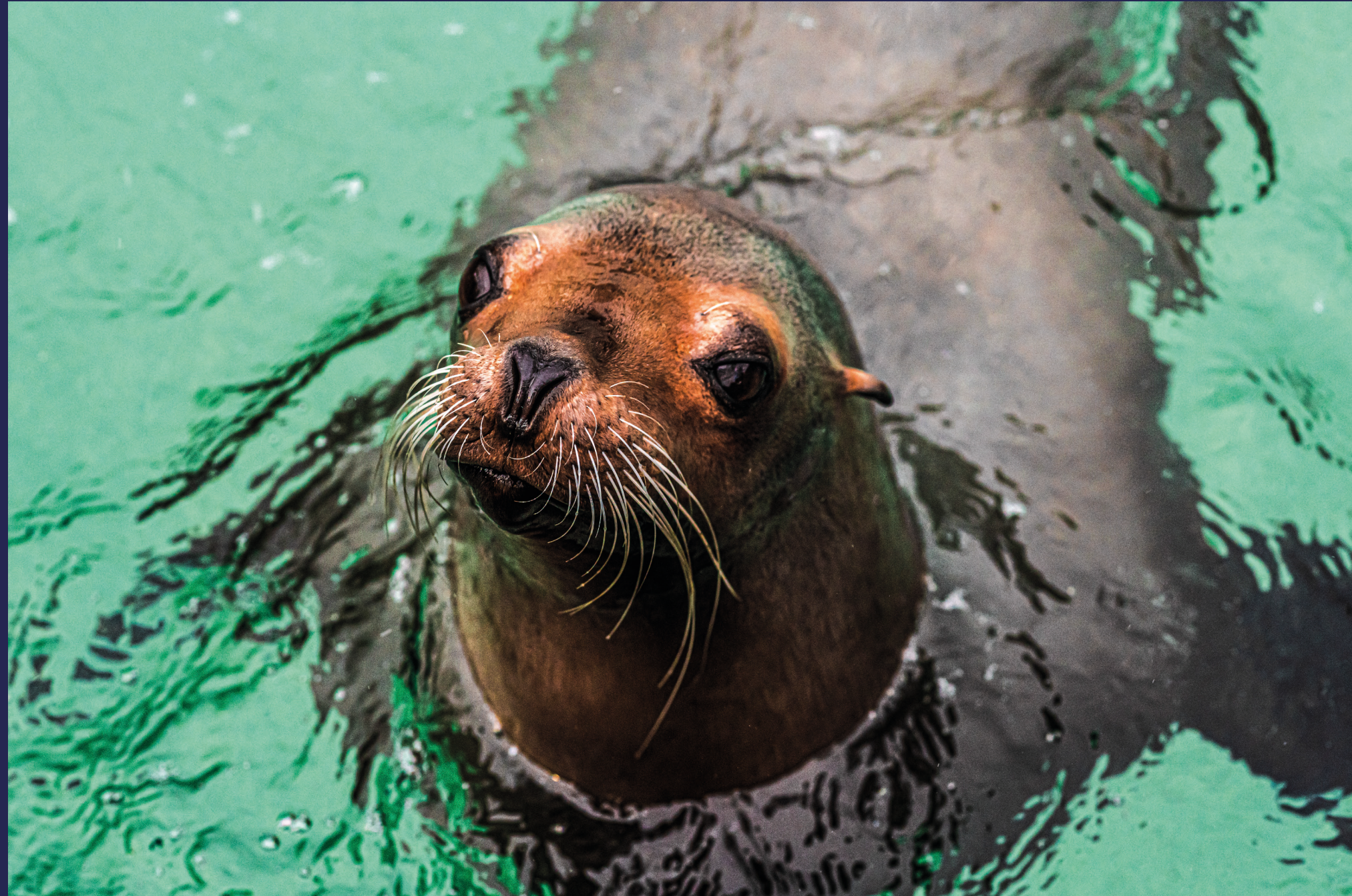
Nysgjerrige California sjøløver