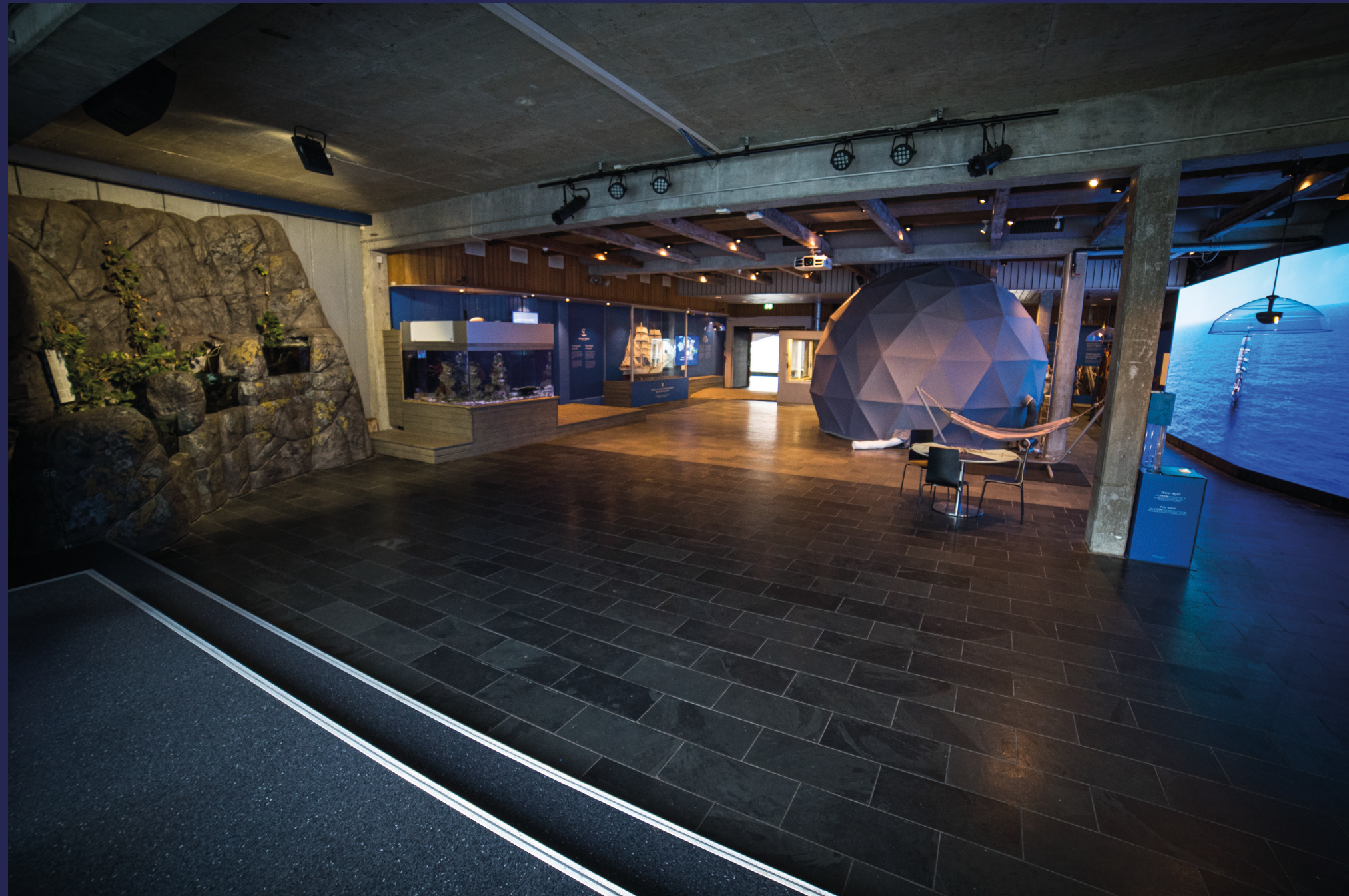
I Storsalen er det alltid rom for nye attraksjoner og interaktive utstillinger.