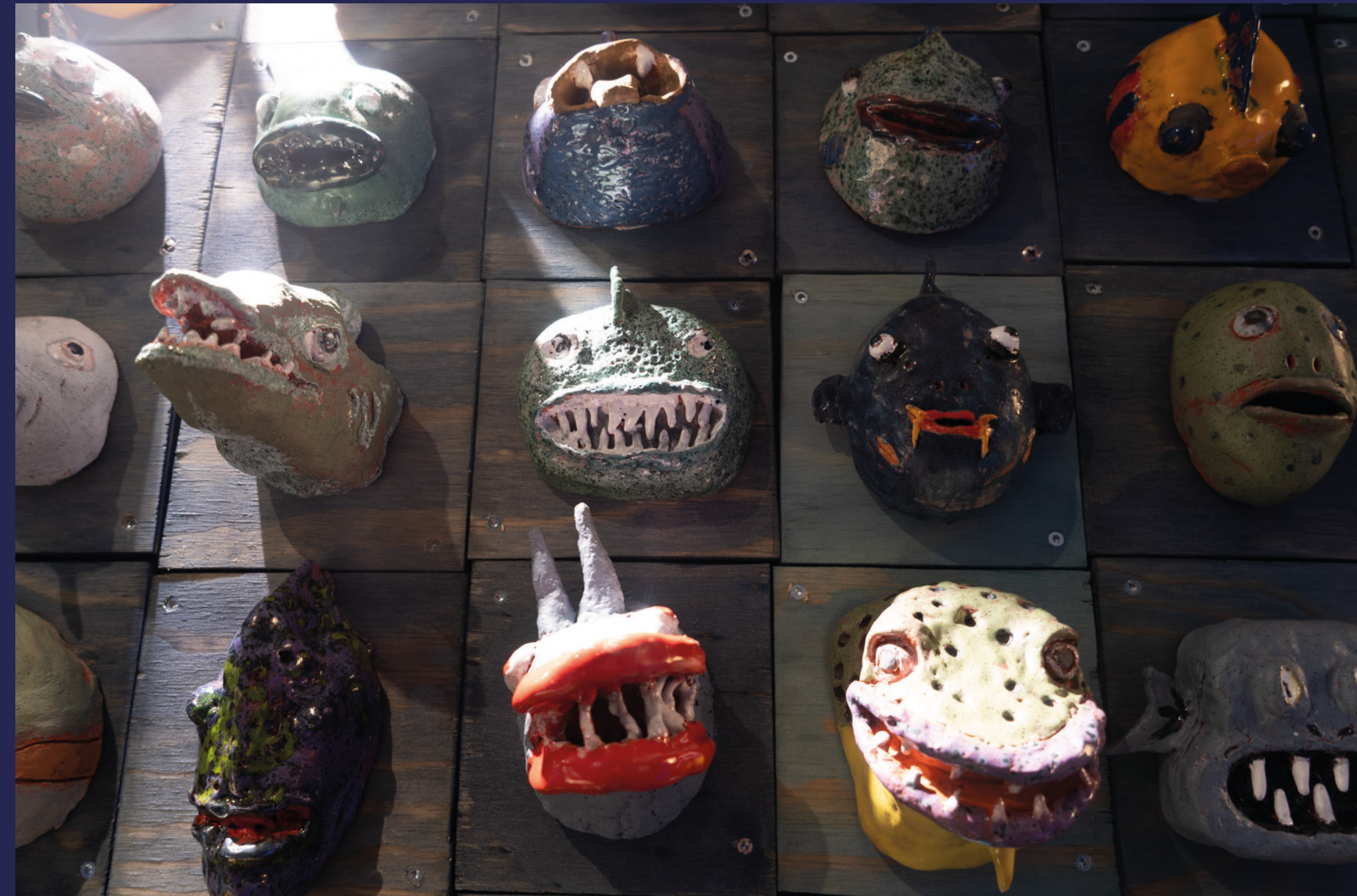
Bli inspirert av dyrisk, spennende, moderne akvariekunst.