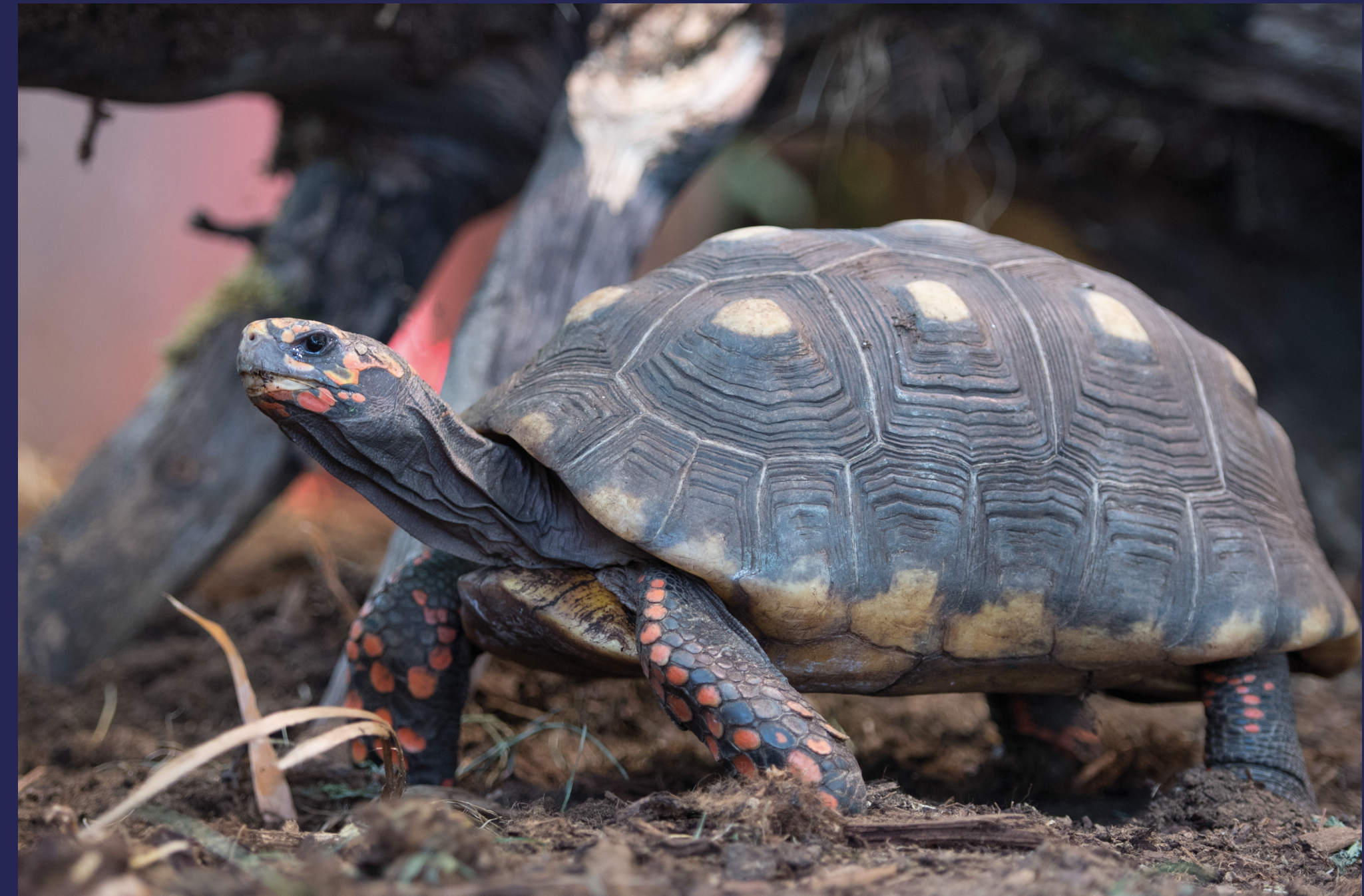
Det er i denne delen av bygget man finner boligens eldste og klokeste beboer.