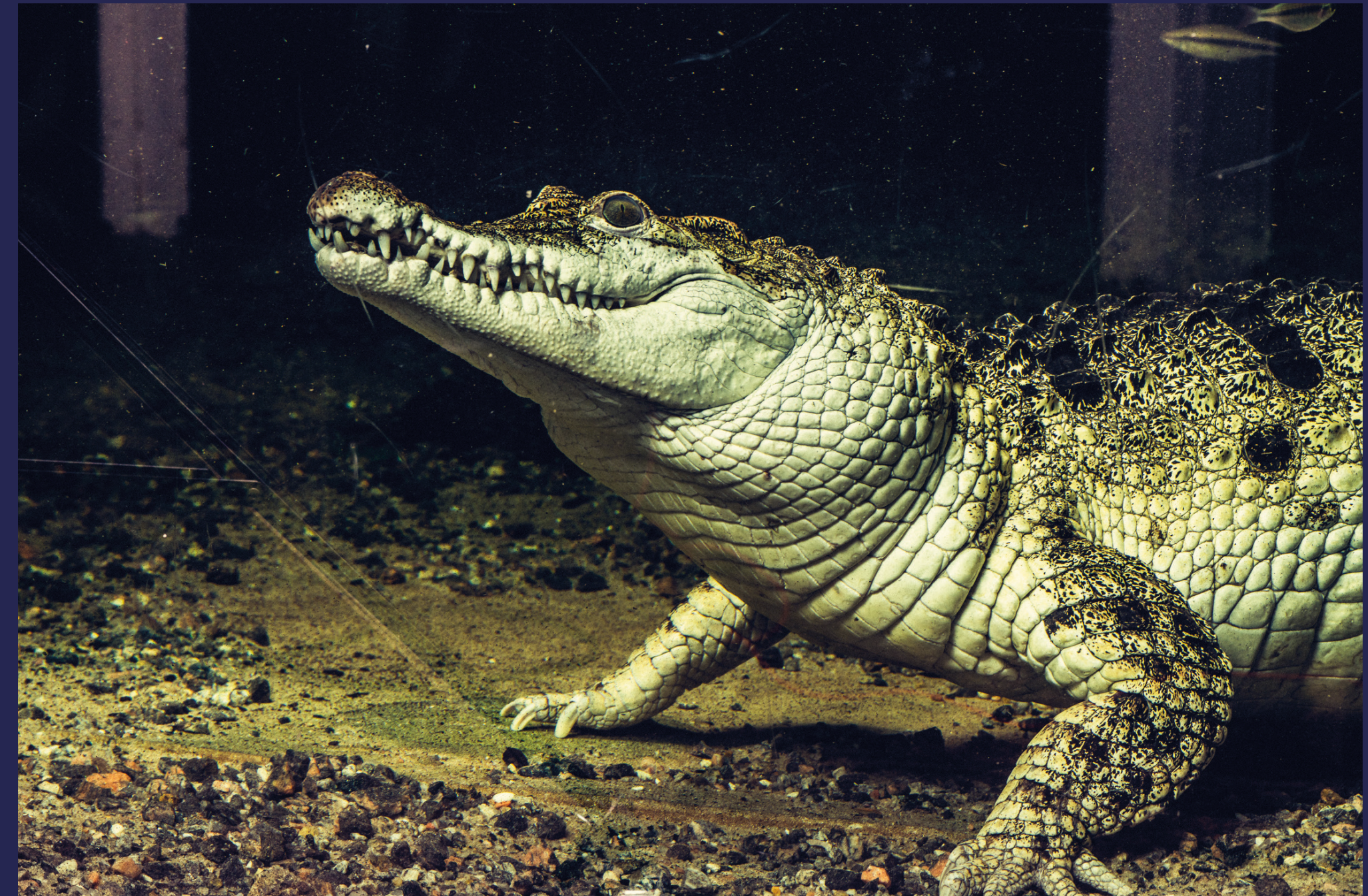
Blant annet dette gliset her