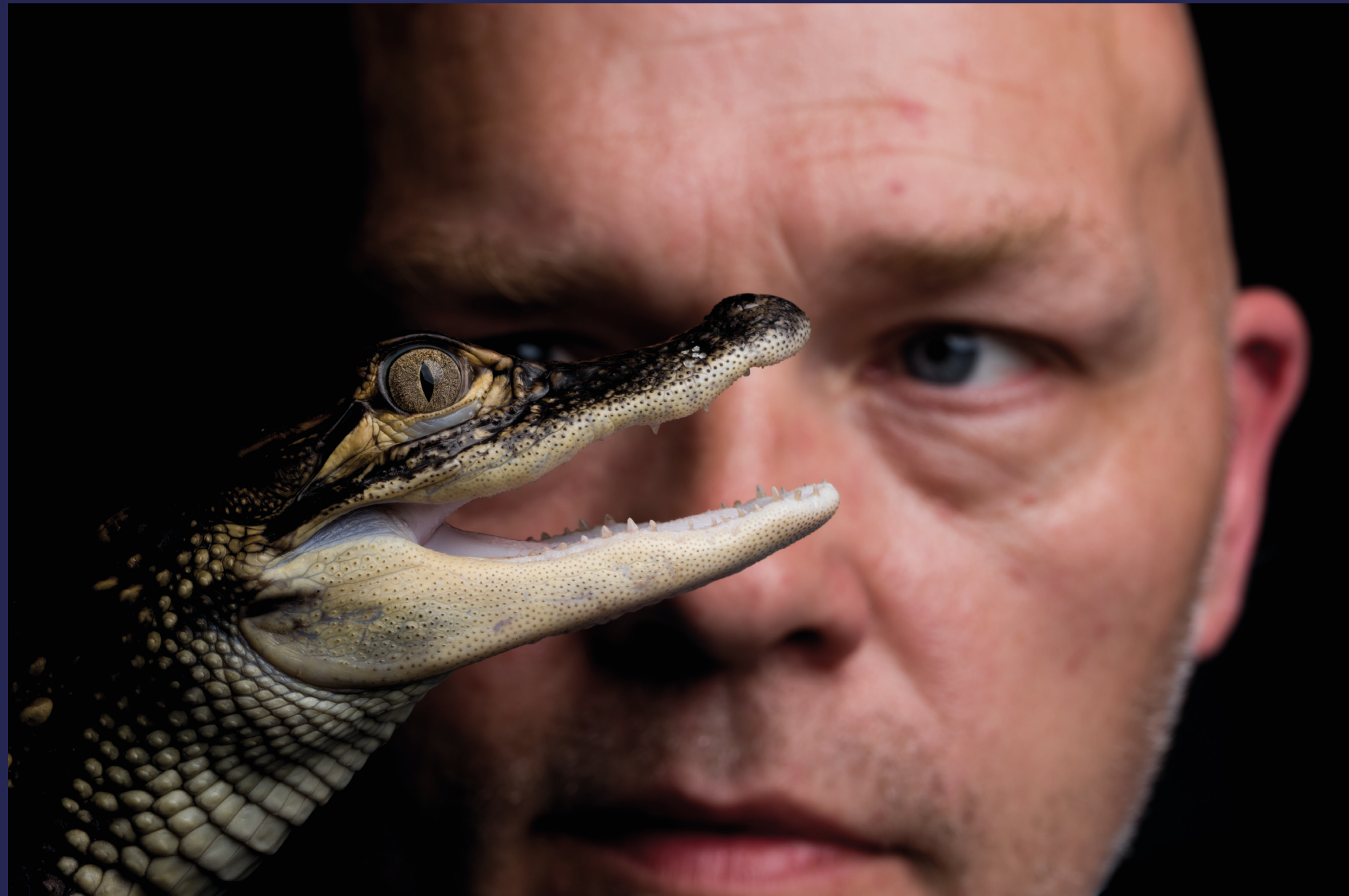
Heldigvis kommer utleieobjektet med eksperter på reptiler