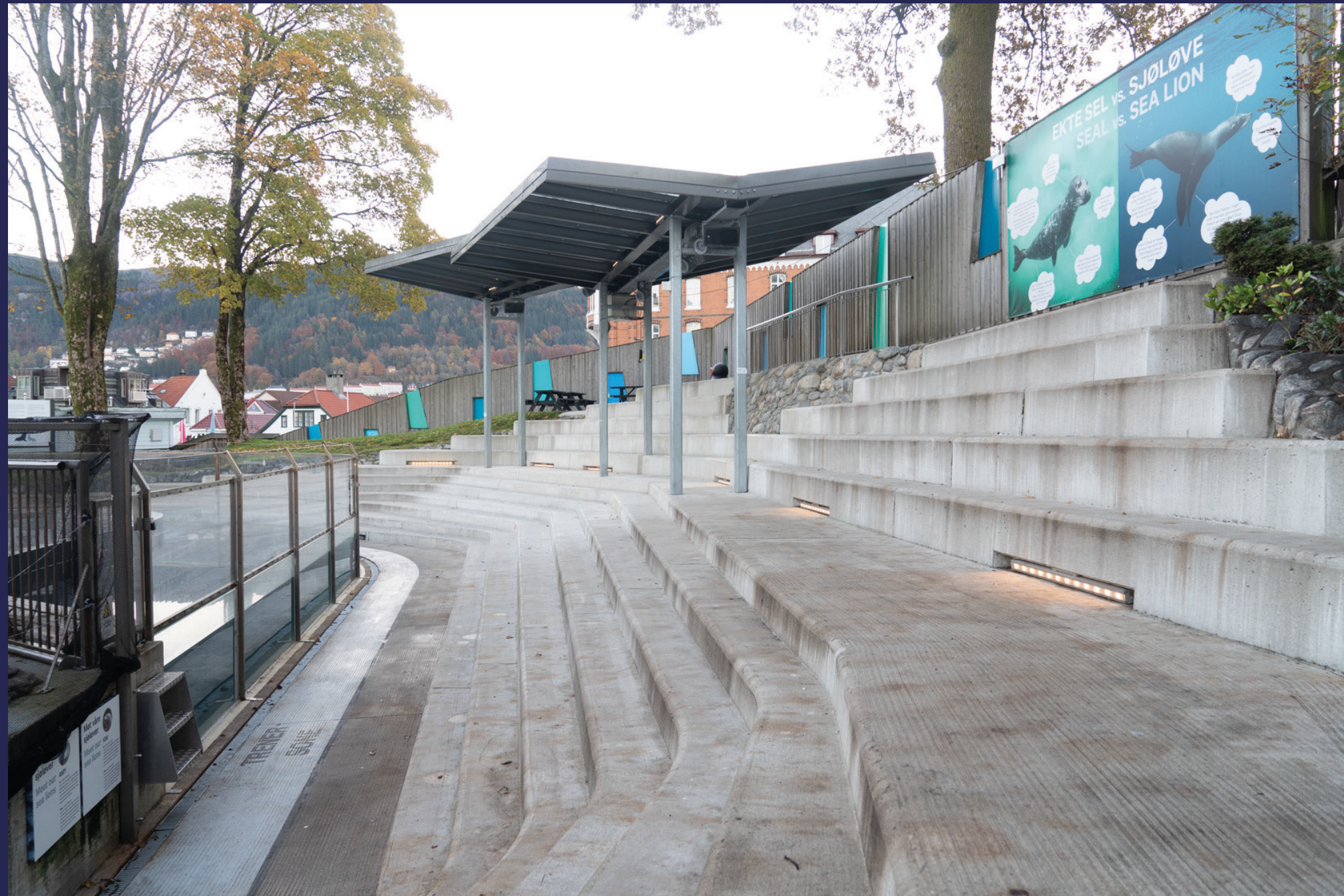
En funksjonell pergola er det perfekte gjemmede på regnfulle dager