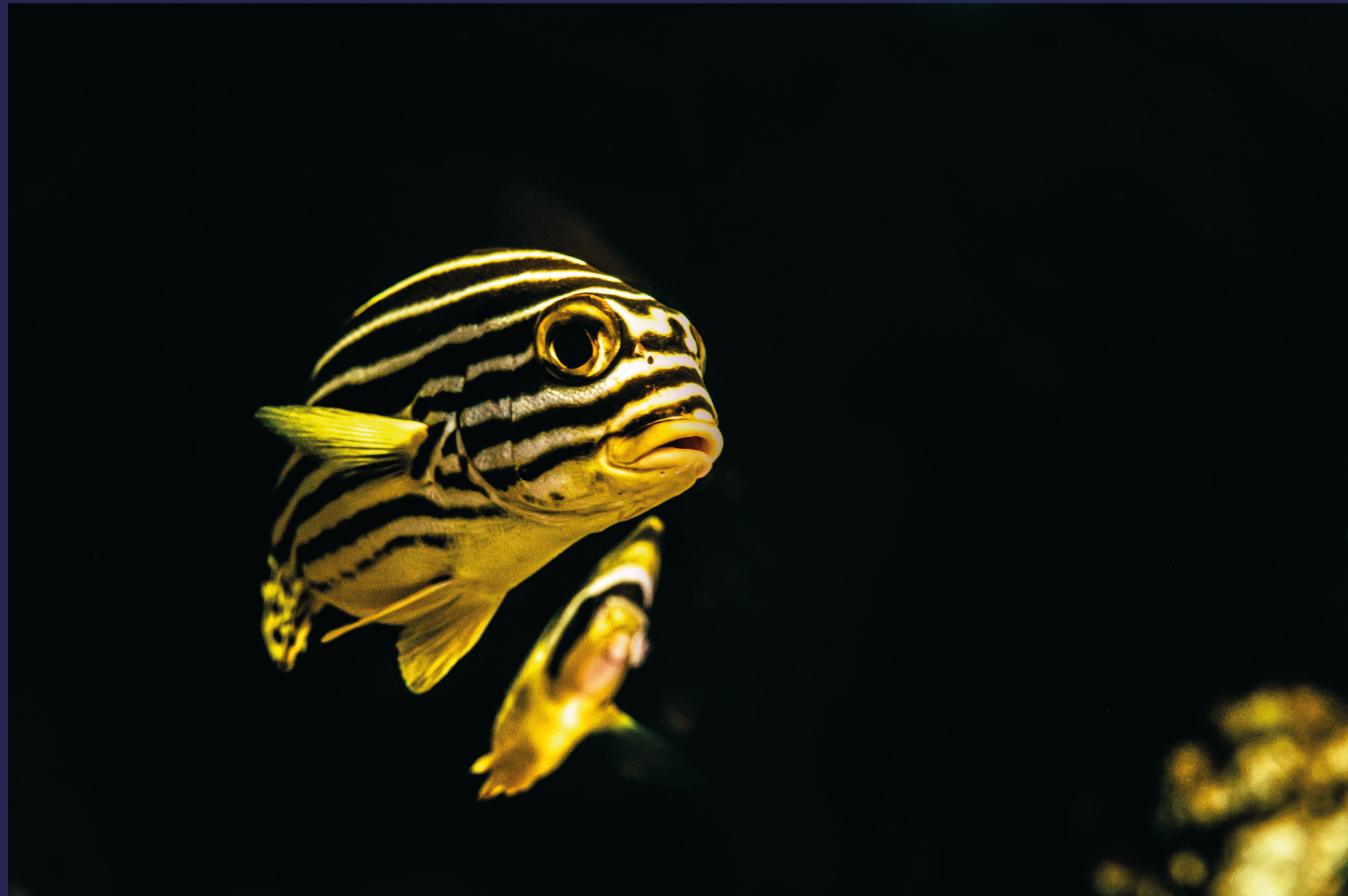
Naturens striper, prikker og farger preger hele denne etasjen.