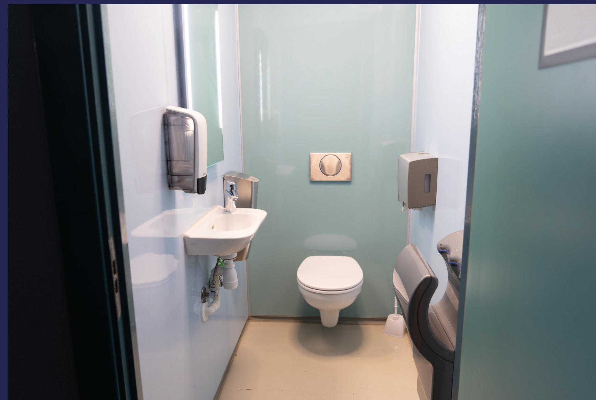
Minimalistisk innredning av toalett med subtile fargevalg