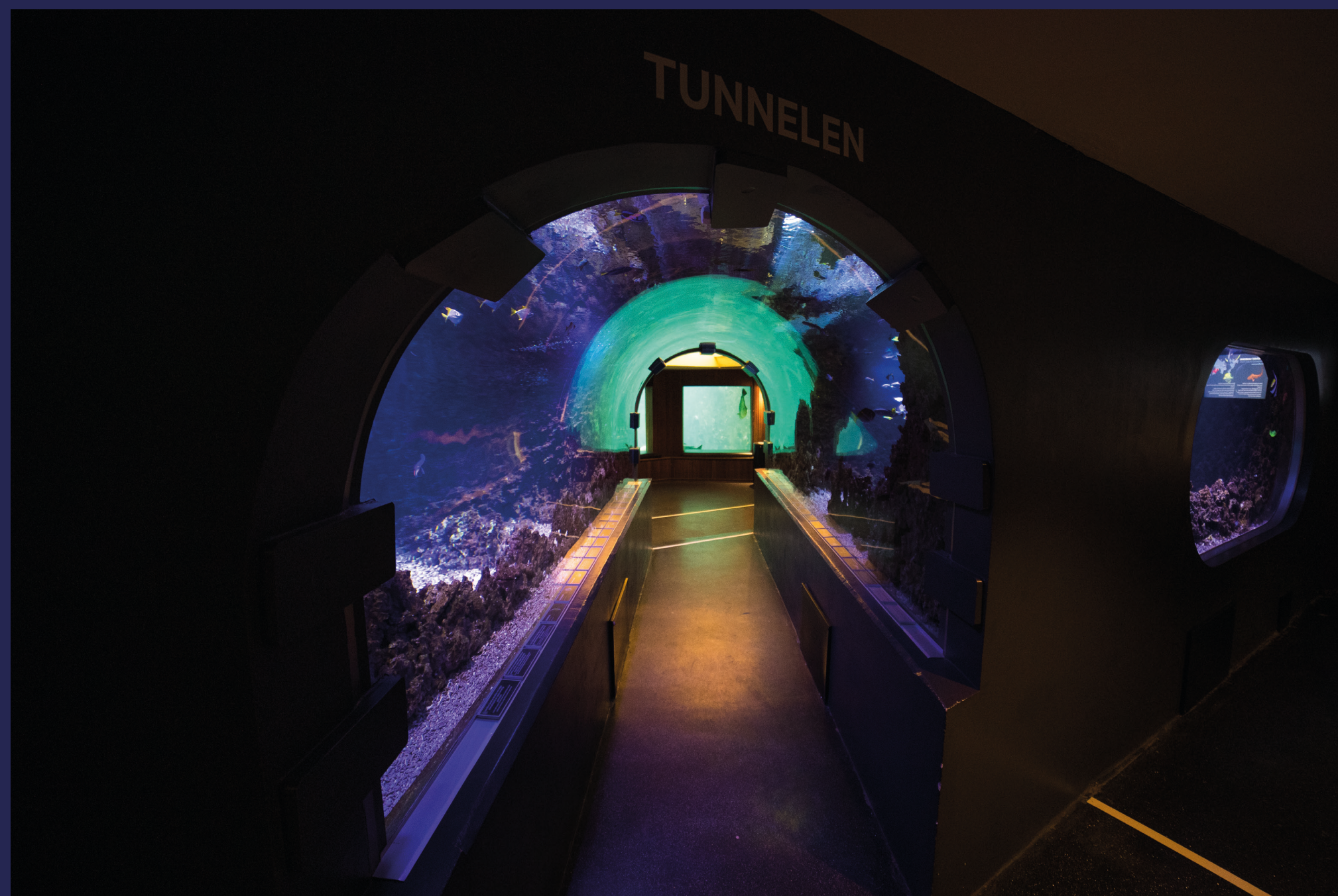
Vi beveger oss ned en etasje og spaserer gjennom den maritime tunnelen.