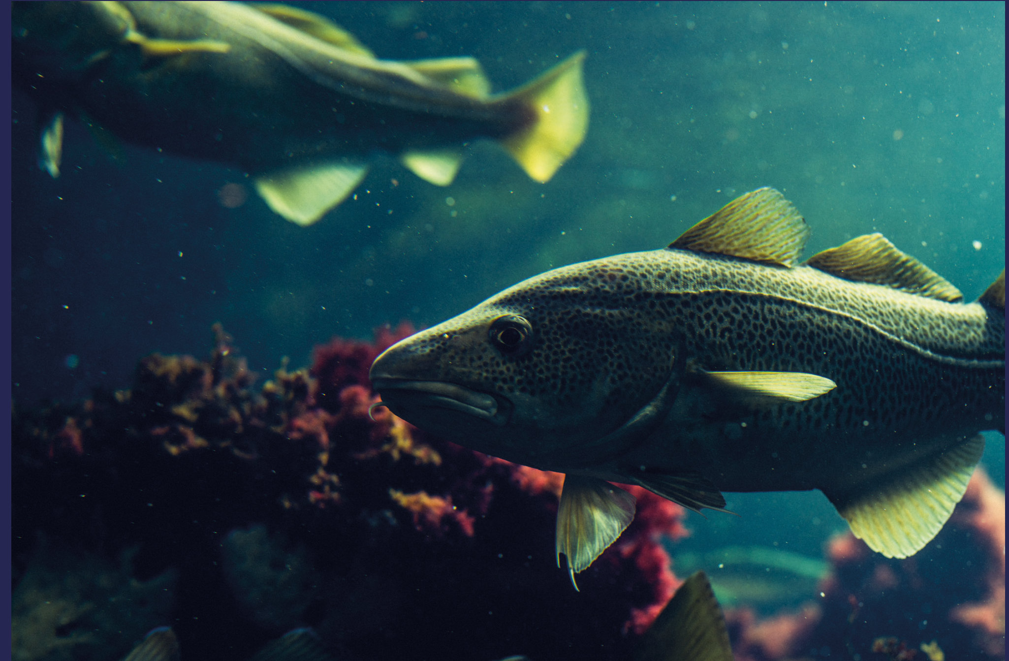
norsk sei og kysttorsk