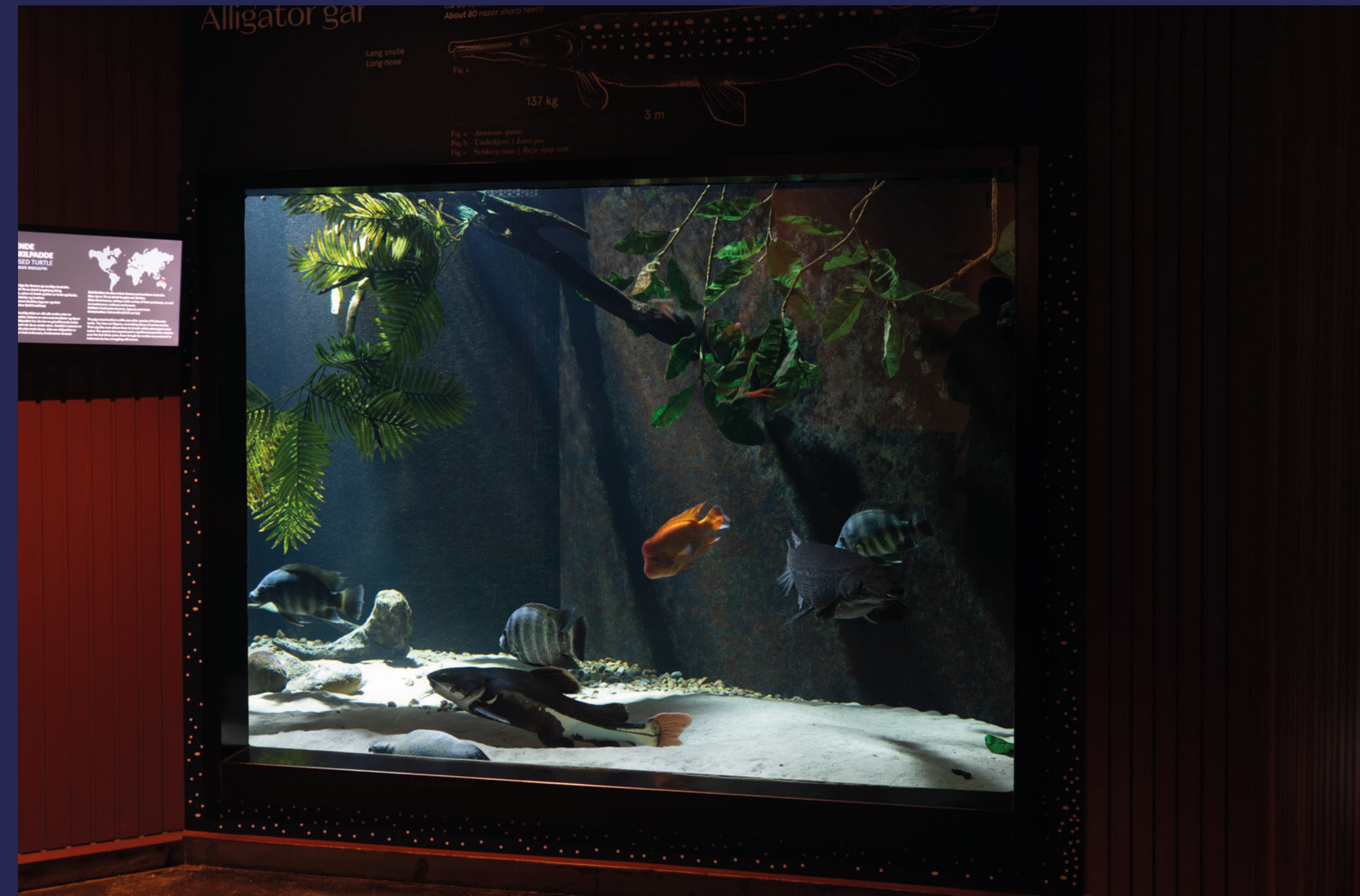
Nei, dette er ikke et maleri, veggene er dekorert med levende kunstverk