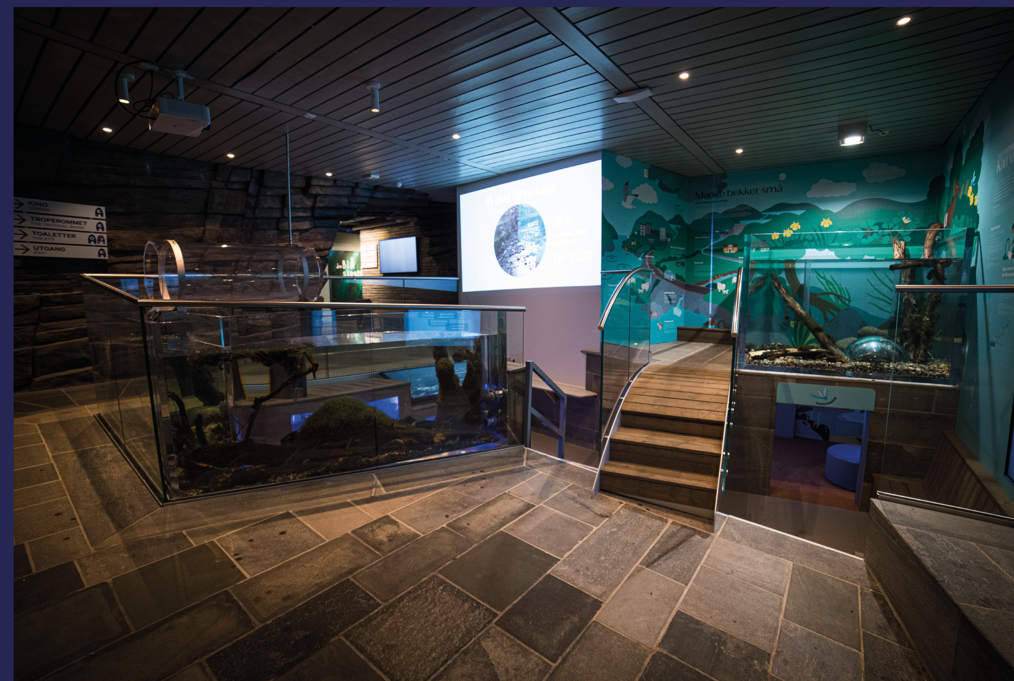
Romdeling og trappeganger inviterer til lærerike avveier