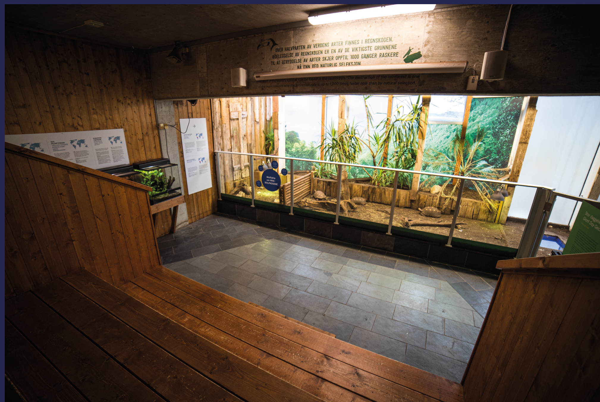
Megler gjør leietaker oppmerksom på at møte med skadedyr kan oppstå