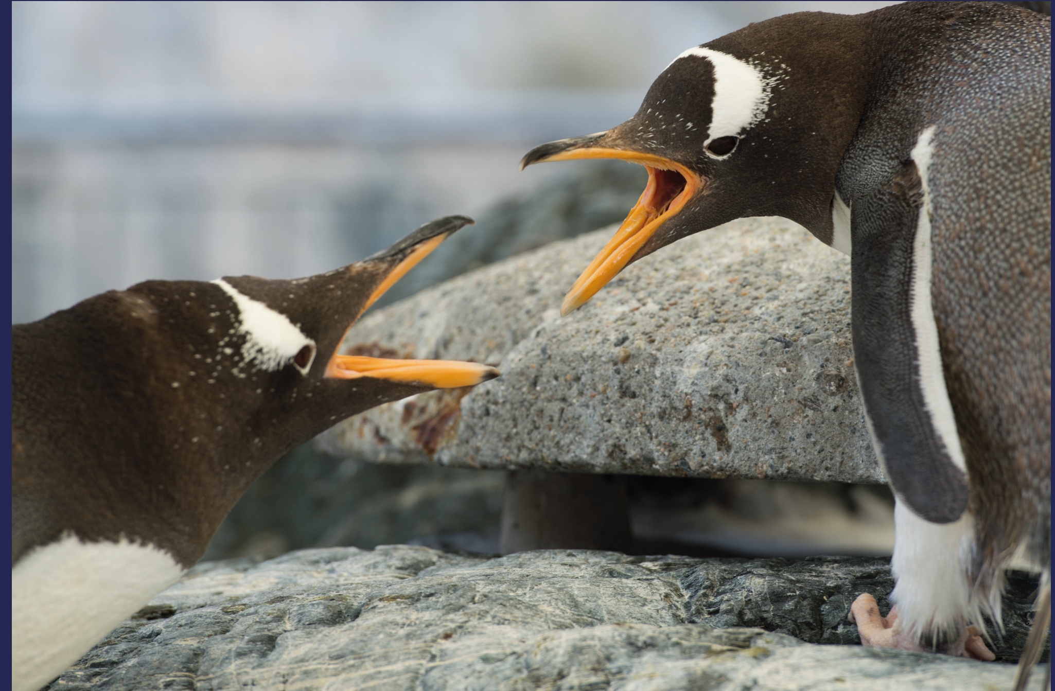
Eller bøylepingvin drama.