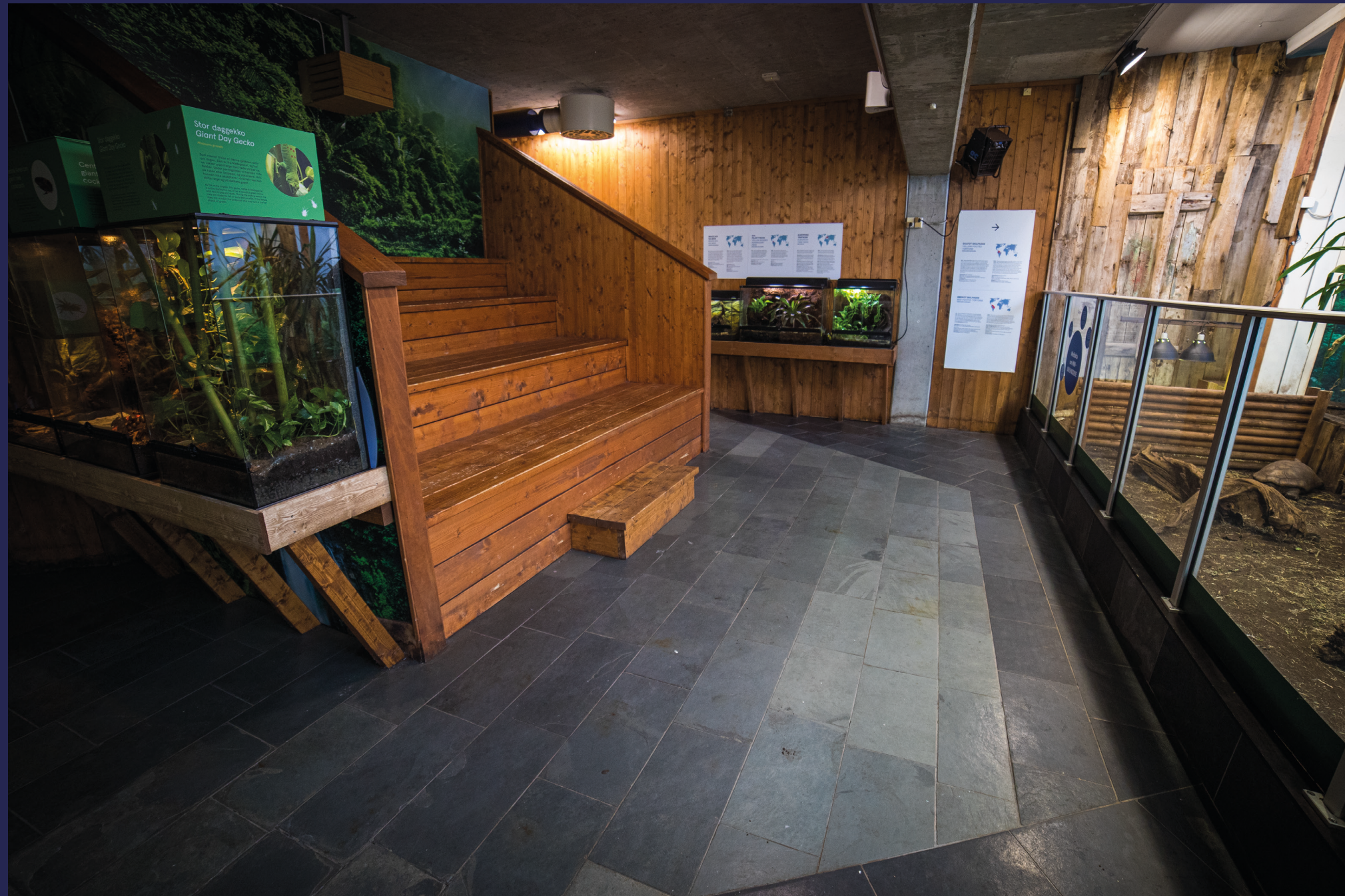
Den avslappende kjelleren gir rom for treige tanker og langsomme drømmer