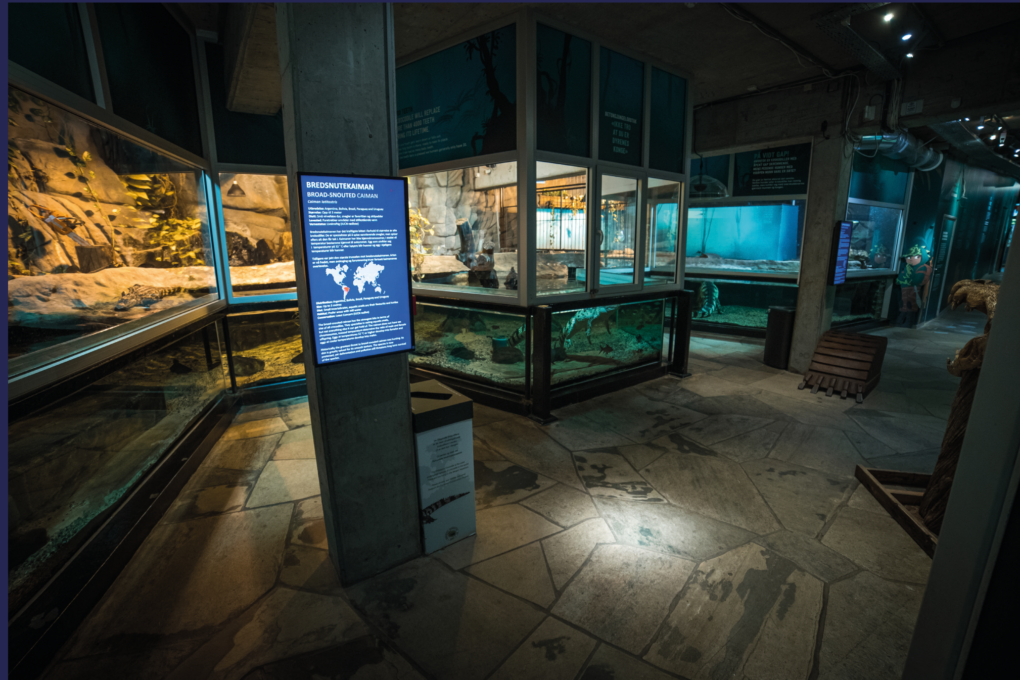
Den mystiske kjelleren inviterer til møte med smilende beboere