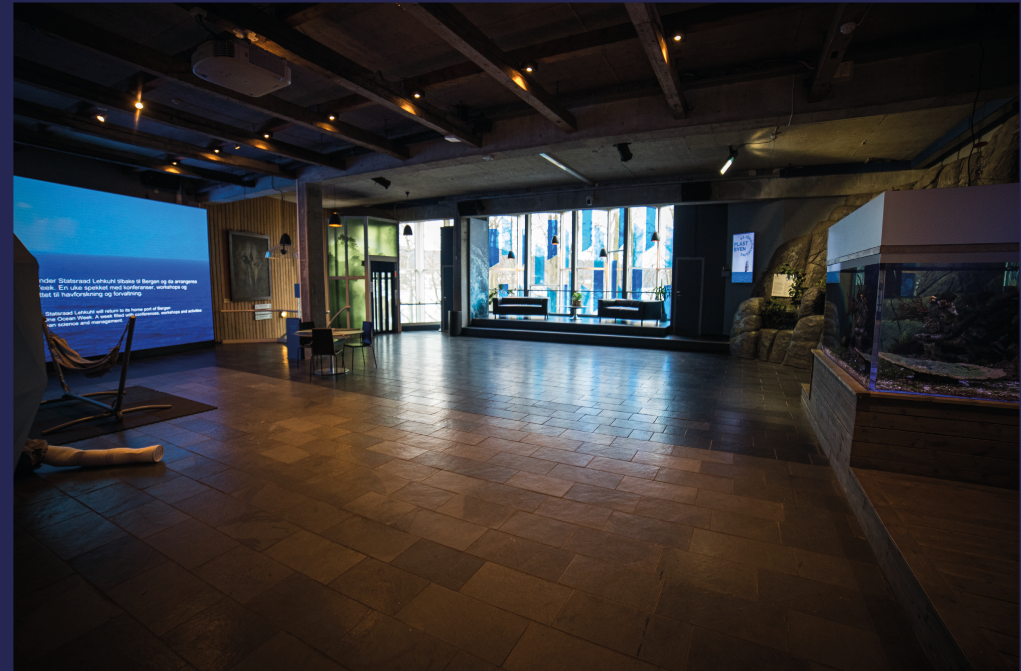
Vi beveger oss inn igjen til hovedetasjen. Naturlig lys slippes inn gjennom byggets øyne.