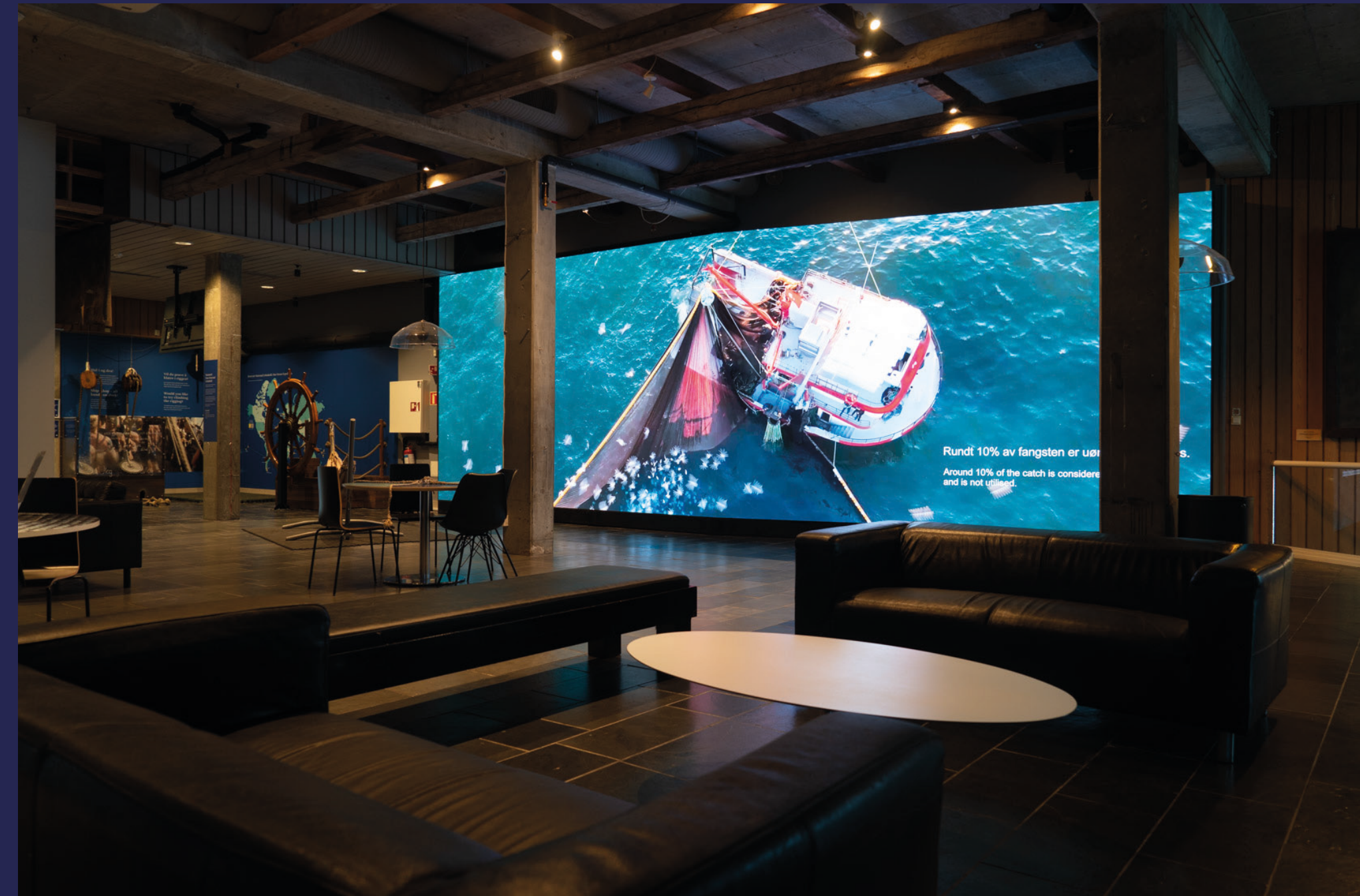
I «TV-stuen» får defnisjonen av widescreen en helt ny mening.