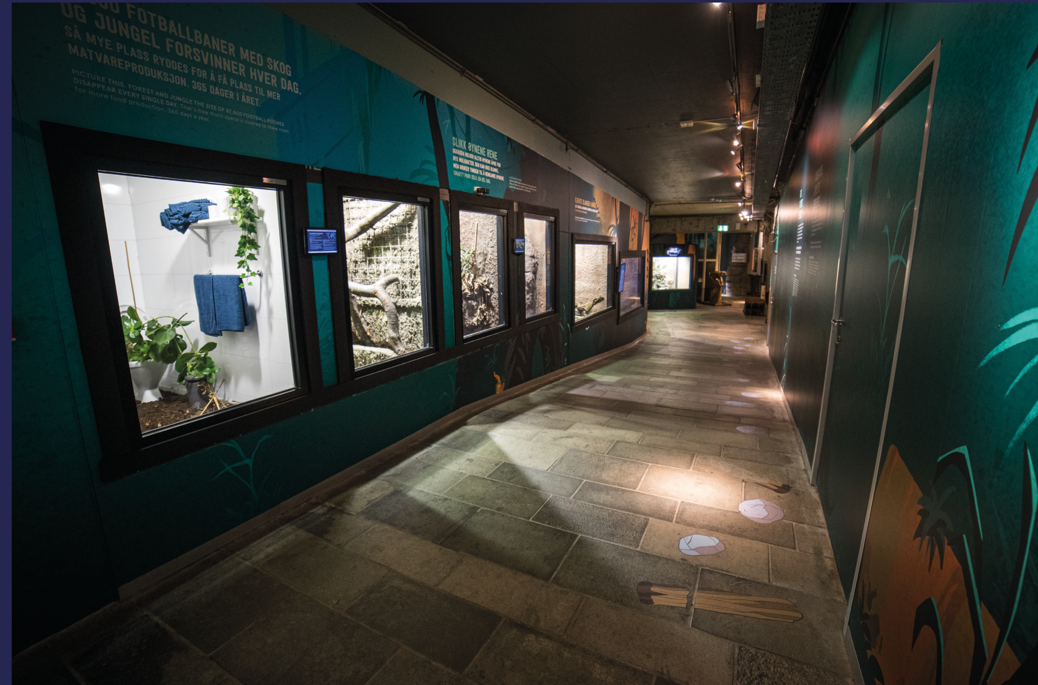
Lange, sleipe og giftige naboer er bare slangene som snor seg i gangene.