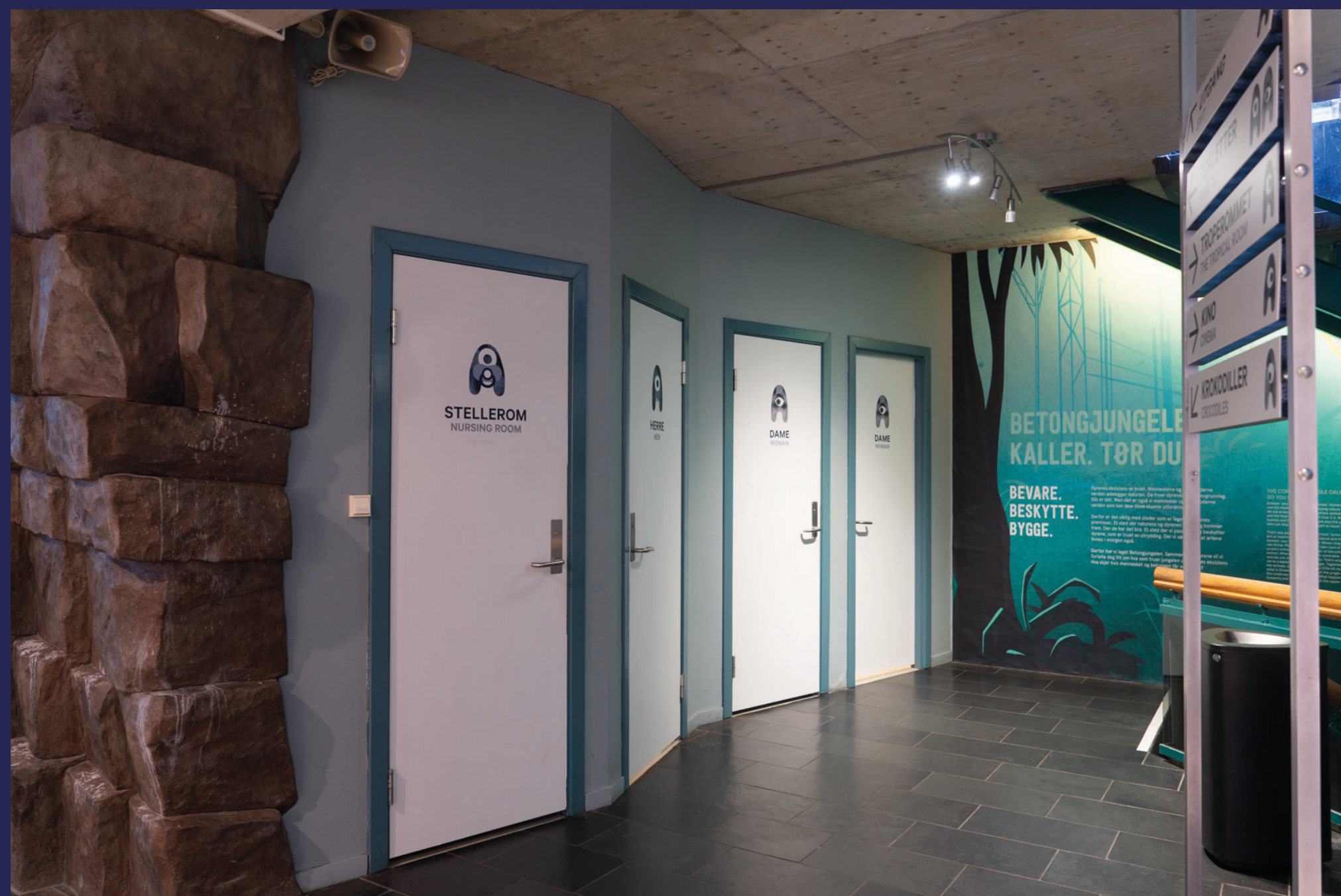
Flere steder i boligen finner man enkel tilgang til nødvendig våtromsfasiliteter