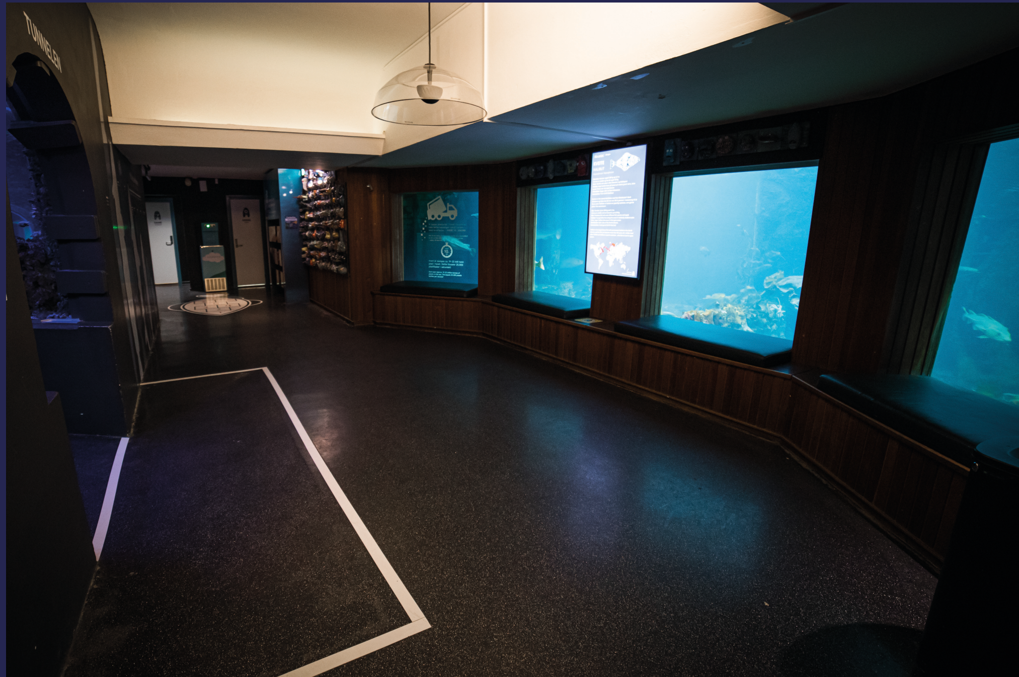
Nakne vegger lar blikket trekkes mot havets vinduer.