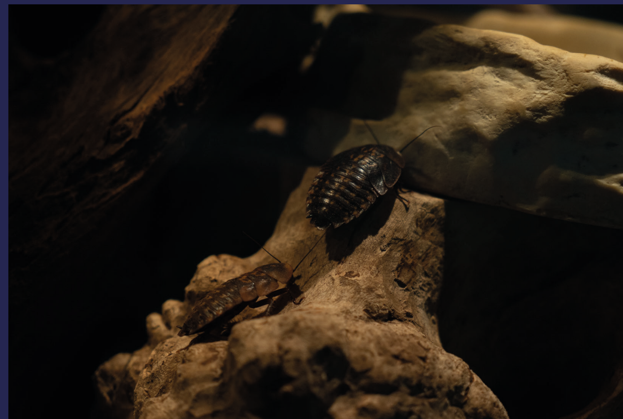
Her kryr det nemlig av kakerlakker.