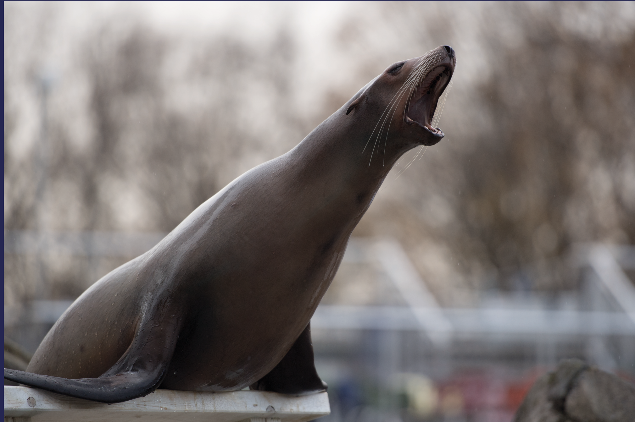
Inntil den blir forstyrret av sjøløvebrøl